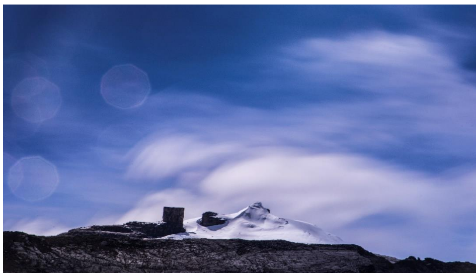
Figura 2. Fotografía de Zizuma (Parque Nacional Natural El Cocuy)

En lo que toca a la diversidad ecológica, destacan los valores que alberga el Parque Nacional Natural El Cocuy, única área protegida sobre la Cordillera Oriental con sierra nevada que, a su vez, contiene la masa glaciaria más extensa de Colombia (ver Figura 2 ). No obstante, pese a ser el ecosistema más conocido del parque, los glaciares son apenas uno entre varios contenidos en los biomas de páramo y de selva andina, con gradientes que van desde los ecosistemas de superpáramo, páramo, subpáramo, pasando por los bosques altoandino, andino y la selva subandina, hasta la selva húmeda tropical de piedemonte (MAVDT & UAESPNN, 2005).