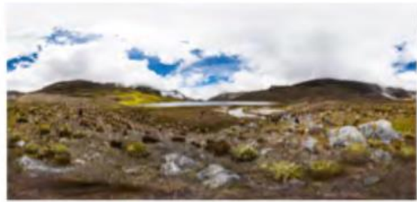
Figura 4. Laguna Grande de los Verdes. Resguardo Unido U'wa

Esas representaciones en torno a Zizuma están en la base de las diversas prácticas de la memoria en el marco del calendario ancestral U'wa, las cuales revelan un fuerte anclaje en el tiempo, con la convergencia del pasado, el presente y el futuro, en una relación que – pese a algunos cambios– se ha conservado desde hace más de 500 años, reflejando el nexo entre indígenas y naturaleza que se transmite en la lengua propia a través de los cantos. Al respecto, Cristancho (2016) explica que