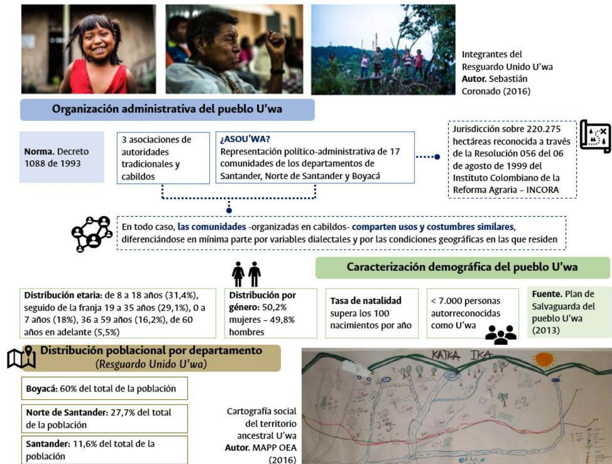
Figura 1. Características distintivas del territorio y de la población U'wa Elaborado a partir de ASOU'WA (2013) & Tegría (2016)

La presencia del pueblo U'wa se extiende sobre los departamentos de Santander, Norte de Santander, Boyacá, Casanare y Arauca, sobre una superficie que representa una mínima parte de lo que históricamente fue el territorio ancestral y de lo que actualmente reclaman (ver Figura 1 ). Esta se distribuye desde los 4.000 metros sobre el nivel del mar, cerca de la Sierra Nevada de El Cocuy, por el norte hasta el valle de Pamplona, y por el sur desde la Sierra Nevada de El Cocuy hasta el piedemonte que comparte Arauca y Casanare (Tegría, 2016).